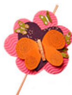
Pense bête papillon de décoration