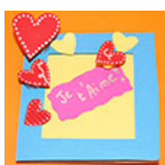
Pense bête aux coeurs en 3D