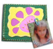
Cadre scrapbooking a la grosse fleur