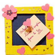
Mini tableau pense-bête aux coeurs