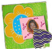
Fleur accroche photo en scrapbooking