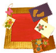
Mini tableau scrapbooking doré