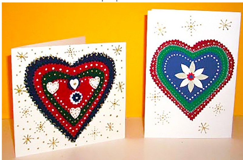
Carte de voeux aux motifs tyroliens

A chacun de créer ses propres cartes de voeux aux motifs inspirés des motifs tyroliens