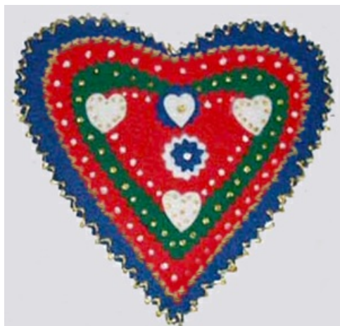
Carte de voeux aux motifs tyroliens