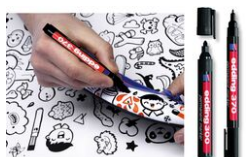
Marqueurs permanents noir