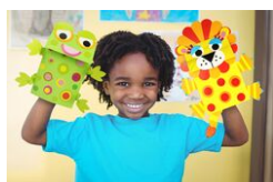
Marionnettes animaux - Set de 5