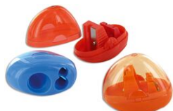
Taille-crayons avec réservoir