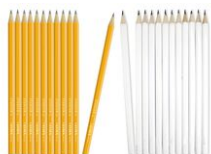
Crayons graphite hexagonaux HB