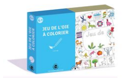
Coffret Jeu de l'oie - Activité Coloriage