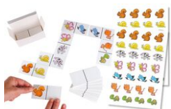
Jeu Dominos à customiser + gommettes