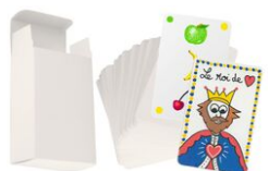
Jeu de 60 cartes et sa boîte à customiser