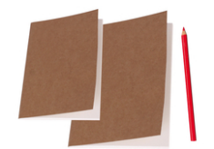
Carnet couverture Kraft - 60 pages