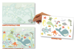
Set carte postale "Ici tout baigne"