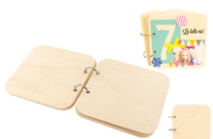
Album photos carré en bois