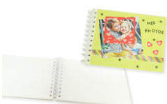
Album photo à spirale