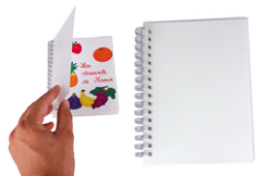
Carnet de notes ou de dessins