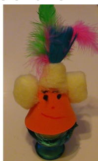
Estèle 3 ans 1/2