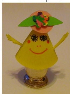
Aurélie 10 ans

Pour vous inspirer voici les réalisations de mes enfants