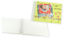
Album photo à spirale