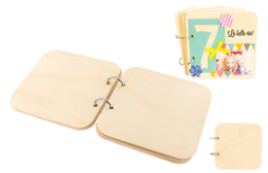
Album photos carré en bois