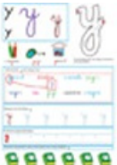
Page du Y