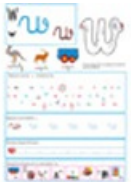
Page du W