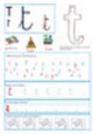
Page du T