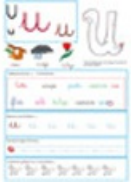
Page du U du livre des minuscules