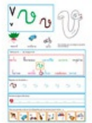
Page du V minuscules