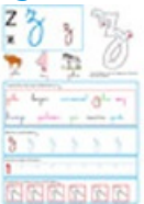
Page du Z en minuscules