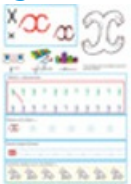
Page du X en minuscules