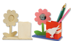
Pot à crayons fleur