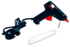
Pistolet à colle + recharge