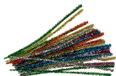
Chenilles couleurs métallisées assorties