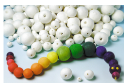
Boules en cellulose blanche