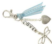
Kit pour fabriquer un porte-clés "LOVE"