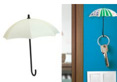
Parapluies porte-clés à décorer - Lot de 3