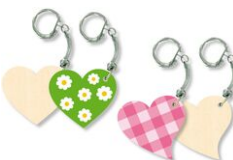
Porte-clés cœurs - Lot de 4