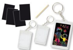
Porte-clés et carte à gratter + grattoirs - Lot de 2