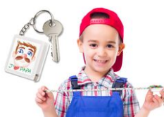
Porte-clés mètre à personnaliser