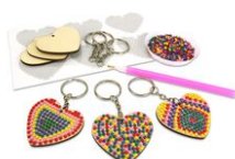
Kit porte-clés diamants - Lot de 6