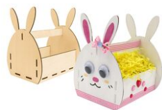
Panier lapin en bois à monter