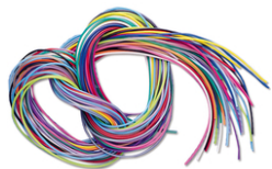
Fils à scoubidou - Set de 100 fils