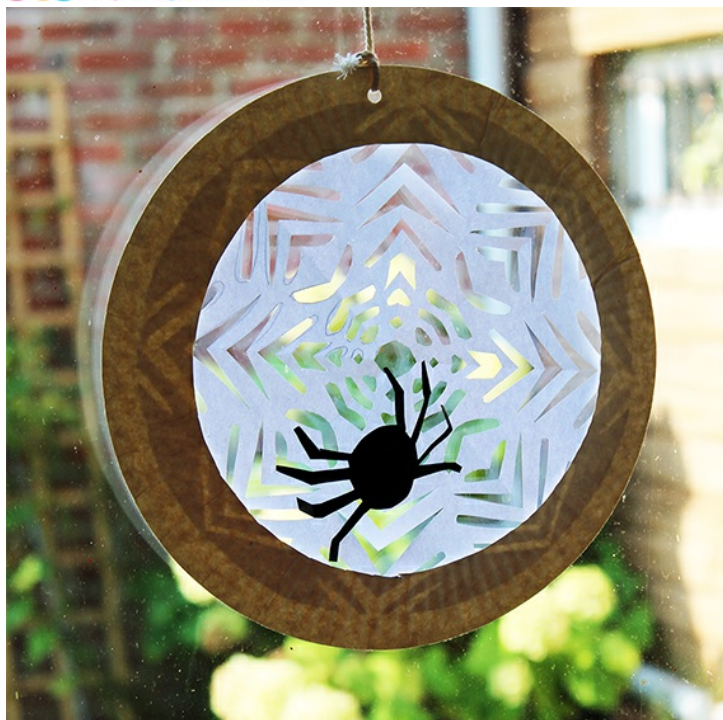
Voir le mobile toile d'araignée