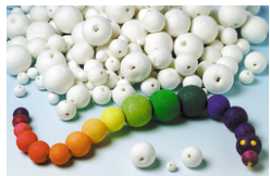
Boules en cellulose blanche