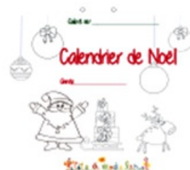
Couverture du calendrier de Noël