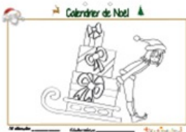
Calendrier de Noël page 16