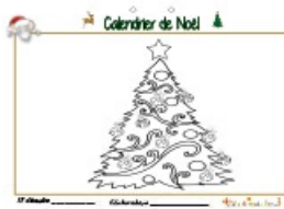
Noël page 17