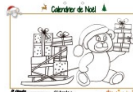
Calendrier de Noël page 21