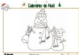
Calendrier de Noël page 19