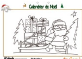
Calendrier de Noël page 22