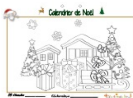
Noël page 23