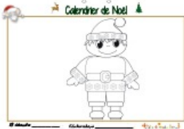
Calendrier de Noël page 13