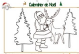
Noël page 20