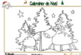
Noël page 14