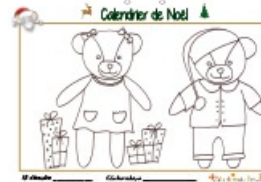
Calendrier de Noël page 15