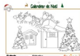
Calendrier de Noël page 24