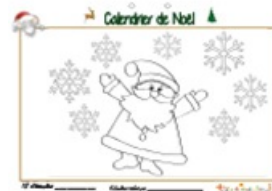
Calendrier de Noël page 18