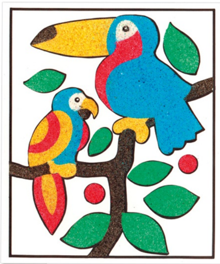
Carte toucan décorée avec du sable

Il ne reste plus qu'à passer à une autre carte !!