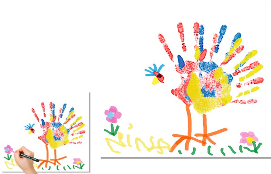
Tableau empreintes de mains