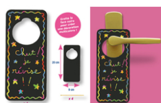
Set de 4 plaques pour poignées de porte en carte à gratter - 4 gratters

Plaques poignée de porte en carte à gratter + accessoires - 4 pcs