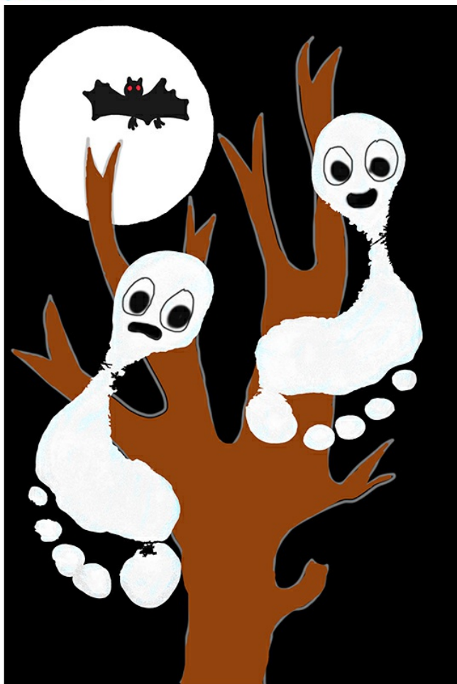
Fantômes empreintes de pieds