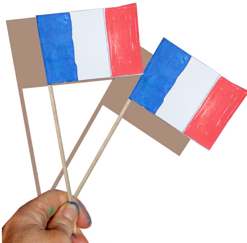
Fanion de la France

Le fanion drapeau de la France est terminé !