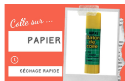
Bâton de colle blanche - Sans solvants