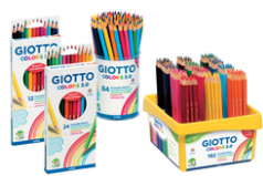
Crayons de couleur GIOTTO Colors 3.0