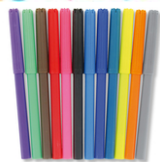
Feutres pointes moyennes - 12 couleurs