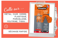
Colle contact Universelle - Avec Solvants