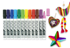
Marqueurs encres permanentes - Multi-support