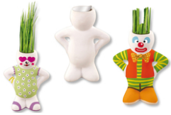
Figurine à coiffer