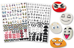
Crazy Face Stickers - 150 Stickers