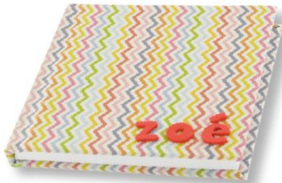
Déco : Magic Paper Chevrons, carnet, stickers lettres