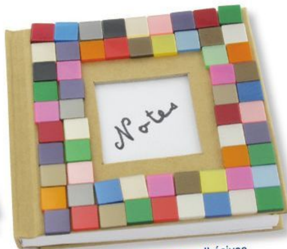
Déco : mosaïques auto-adhésives ou acryliques