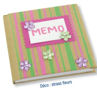
Déco : strass fleurs