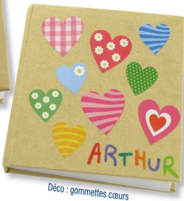
Déco : gommettes cœurs