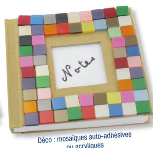
Déco : mosaïques auto-adhésives ou acryliques