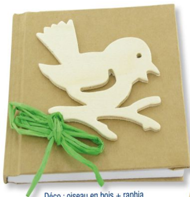
Déco : oiseau en bois + raphia