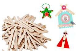
Bâtons d'esquimaux en bois