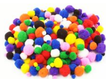
Pompons couleurs vives et tailles assorties