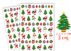
Gommettes Noël - 2 planches