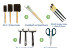
Set spécial matériels VERNIS COLLAGE