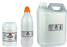
Vernis-colle 10 DOIGTS