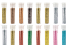
Paillettes diamantines ultra-fines - Set de 4