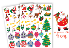
Gommettes de Noël - 2 planches