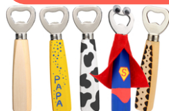
Décapsuleur en bois et métal