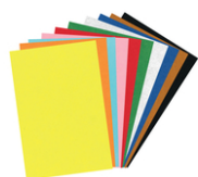
Feutrine 20 x 30 cm - 10 couleurs assorties