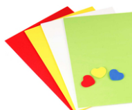
Feuilles de mousse - à la couleur