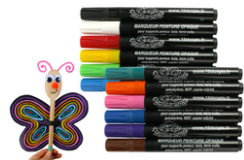
Marqueurs peinture pour Bois, Cartons, Terre cuite...