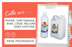
Brut de Colle - Colle forte qualité professionnelle