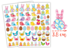
Gommettes de Pâques Vichy - 2 planches