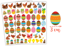
Gommettes de Pâques - 2 planches