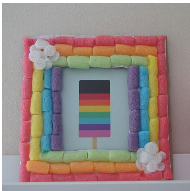
TABLEAU ARC EN CIEL EN PLAYMAÏS