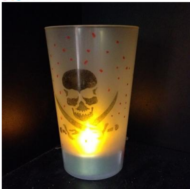
ETAPE 7 : LE GOBELET 3 EN 1...