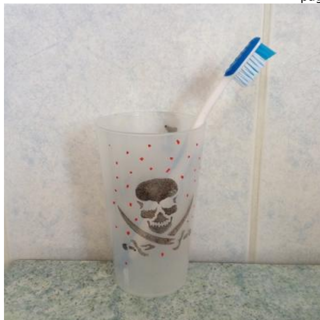
ETAPE 8 : LE GOBELET 3 EN 1...