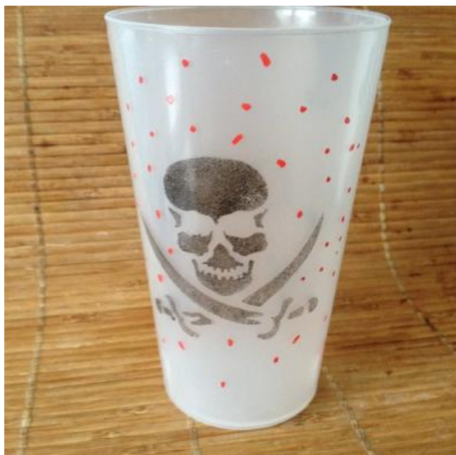
ETAPE 9 : LE GOBELET 3 EN 1...