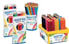
Crayons de couleur GIOTTO Colors 3.0