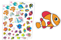
Gommettes poissons - 2 planches