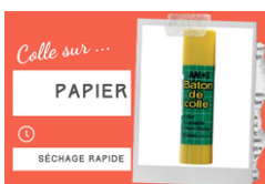
Bâton de colle blanche - Sans solvants