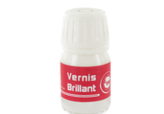
Vernis brillant - 60 ml