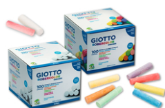
Craies blanches ou colorées - 100 pièces