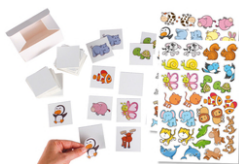
Jeu memory à customiser - 60 cartes + boîte