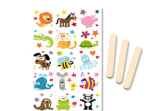
Transferts décalcomanies - Animaux