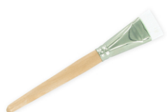
Brosse large à poils courts qualité supérieure