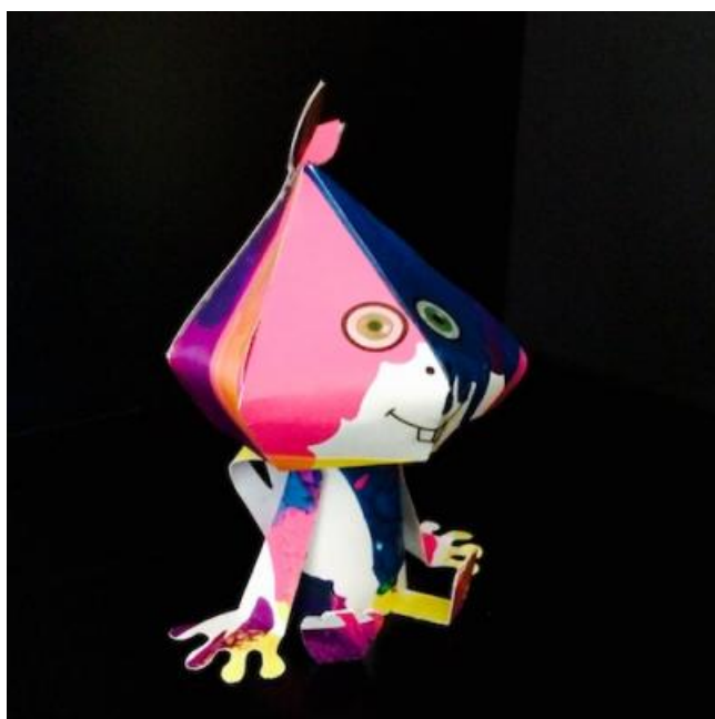
ETAPE 13 : RÉSULTAT