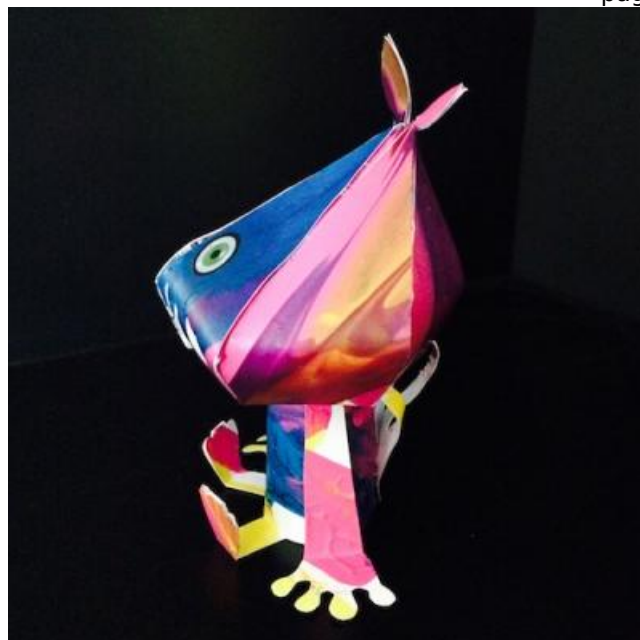
ETAPE 12 : RÉSULTAT

Le paper toy du petit martien une fois terminé. Vue de face.