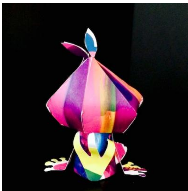
ETAPE 14 : RÉSULTAT