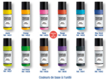
Peinture acrylique extra qualité - 80 ml