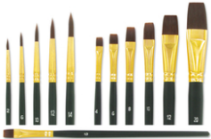
Pinceaux à poils synthétiques