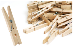
Pinces à linge en bois