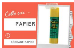
Bâton de colle blanche - Sans solvants