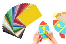
Papiers épais teintés (300 gr) Format A4 - Couleurs au choix