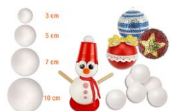
Boules en polystyrène