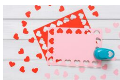
Perforatrices thème "Cœur" - à l'unité