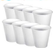
Gobelets en carton blanc