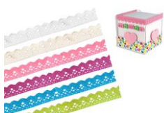
Rubans en dentelle adhésive - 1 m