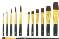
Pinceaux à poils synthétiques