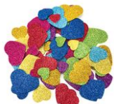
Stickers cœurs pailletés en caoutchouc mousse - 70 pièces