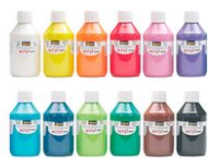
Peinture acrylique opaque 80 ou 250 ml - large choix de couleurs