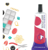
Colle Bijoux Hasulith - 30 ml Réf : 17012