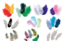
Plumes camaïeu de couleurs au choix - Set d'environ 50 plumes