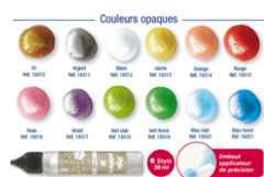
Stylos peinture 3D, qualité supérieure - 30 ml