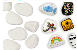
Galets en marbre blanc - Lot de 6 Réf : 11519