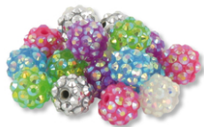
Perles "Disco" 7 couleurs- 21 perles