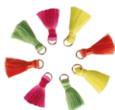
Mini pompons fluo sur anneaux - 8 pièces