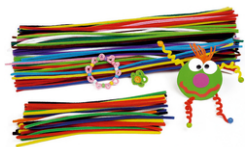
Chenilles couleurs assorties