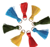
Mini pompons vifs sur anneaux - 8 pièces