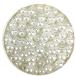
Perles blanches nacrées - Qualité économique