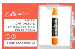
Colle forte avec double applicateur - Sans Solvants