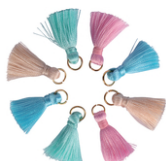
Mini pompons pastel sur anneaux - 8 pièces