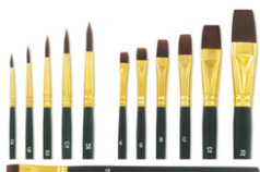
Pinceaux à poils synthétiques