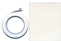
Mousse adhésive double-face effet 3D