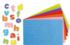
Stickers lettres minuscules en caoutchouc - 950 pièces