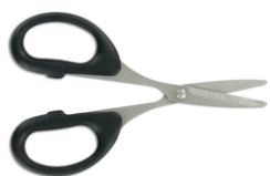
Ciseaux de précision