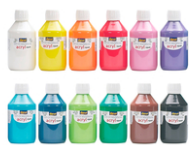
Peinture acrylique opaque 80 ou 250 ml - large choix de couleurs