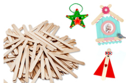
Bâtons d'esquimaux en bois