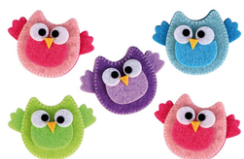
Stickers Hiboux en feutrine