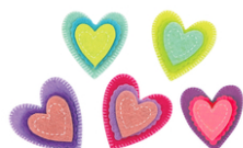
Stickers coeurs en feutrine