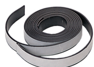
Bande aimantée adhésive