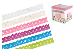
Rubans en dentelle adhésive - 1 m