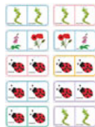
Planche 8 à imprimer pour fabriquer le domino des fleurs