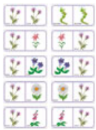
Domino fleurs Planche 1

Imprimez toutes les planches du jeu de dominos des fleurs :