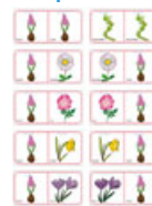
Planche 13 des Domino sur les fleurs de printemps et d'été