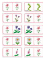
Domino sur les fleurs - 2