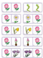
Domino fleurs à imprimer - imprimer la planche 11