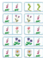
Domino sur les fleurs Planche 5