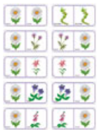
Domino des fleurs - planche 4