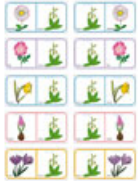
Planche Domino des fleurs 14