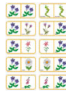
Domino des fleurs - planche 3