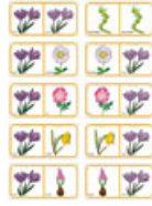
Planche de fleurs pour fabriquer un jeu de domino