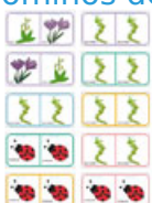
Planche de fleurs N°17 pour fabriquer un