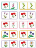
Domino sur le nom des fleurs - planche 7