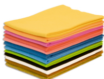
Plaque de Feutrine colorée - 50 x 70 cm