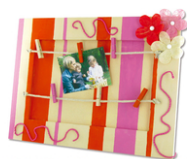
Cadre pêle-mêle en bois