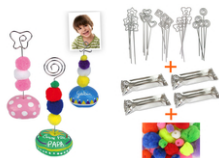
Kit porte-photos - Pour 25 réalisations