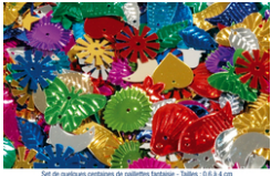
Set de grandes paillettes fantaisie, formes et couleurs assorties avec trou