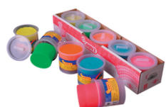
Pâte à modeler fluo (dès 2 ans) - 5 pots de 110 gr