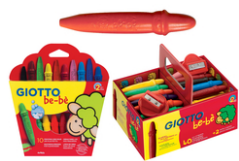
Crayons cire incassables Giotto Bé-bé + taille-crayons