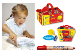
Crayons de couleur Giotto - A partir de 2 ans