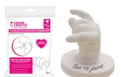
Alginate spéciale nourrisson 200 gr - Prise rapide