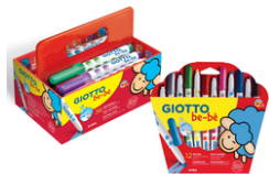
Feutres Giotto Bé-bé - Dès 2 ans