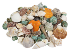
Coquillages naturels - Sachet de 500 gr