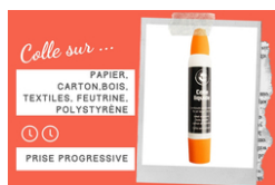
Colle forte avec double applicateur - Sans Solvants