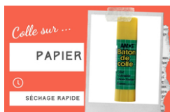
Bâton de colle blanche - Sans solvants