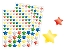
Gommettes étoiles métallisées - 2 planches