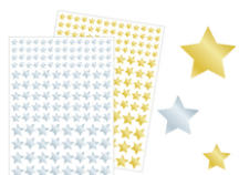
Gommettes étoiles métallisées or et argent - 2 planches