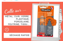
Colle contact Universelle - Avec Solvants