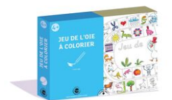
Coffret Jeu de l'oie - Activité Coloriage