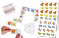
Jeu Dominos à customiser + gommettes