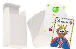
Jeu de 60 cartes et sa boîte à customiser