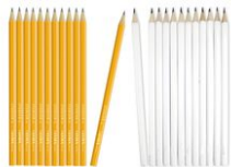
Crayons graphite hexagonaux HB