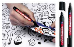
Marqueurs permanents noir