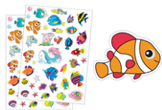
Gommettes poissons - 2 planches