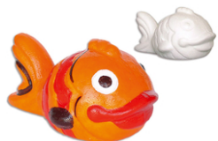
Poisson en polystyrène