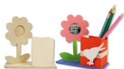
Pot à crayons fleur