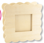
Pot à crayons porte-photo