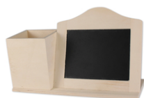
Set de bureau ardoise + pot à crayons