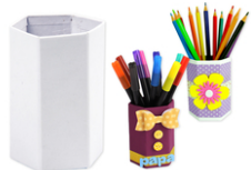
Pots à crayons hexagonaux en carton blanc