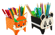
Pots à crayons panda et renard - Set de 2