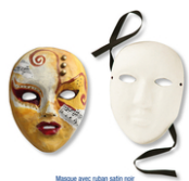
Masque en papier comprimé recyclé blanc avec ruban satin noir