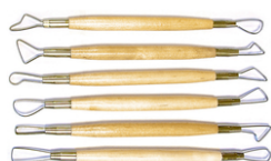
Mirettes assorties avec manches en bois - Set de 6