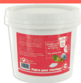
Plâtre de moulage