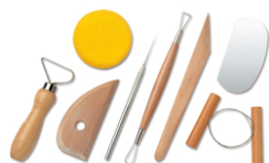
Outils modelage poterie - Set de 8