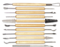
Outils pour modelage fin - Set de 11