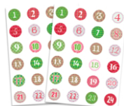
Stickers chiffres calendrier de l'Avent - 48 pcs