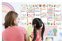
Calendrier Géant anniversaires à colorier