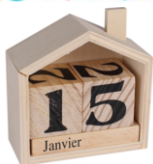
Calendrier perpétuel maison